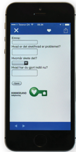
Udfyld felterne og send